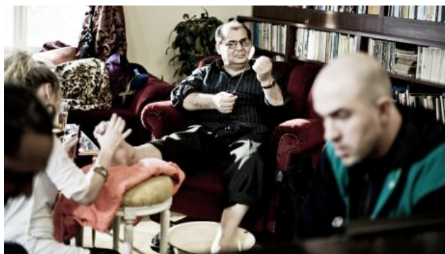
Még a kívülről szokványos életet élő szereplők is valódi különcök

A film rengeteg szereplőt mozgat, a karaktereket amatőr színészek formálják meg. Többségük remekül helytáll, de akad közöttük néhány, aki hamisságával szinte az egész történeteszálát megmérgezi. A Papírrepülőök ben az underground kultúra a zenehasználat és a tetszetős képi világ segítségével izgalmas megjelenítést nyer, a kézi kamera és a bevilágítatlan terek remekül illenek ehhez a közeghez. Az új évezred román filmje óta tudjuk, hogy az alacsony költségvetés és a szűkös technikai feltételek nem feltétlenül mennek a történetmesélés rovására, sőt, sokszor anyagszerűvé teszik a bemutatandó közeget.